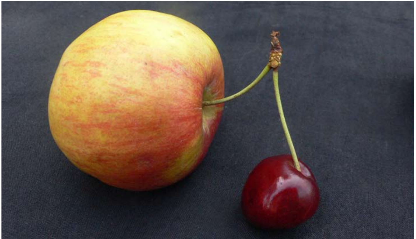
Foto: Judith Eicher, nach der didaktischen Aufgabenstellung «Mach dir selber ein Bild – Eine Hommage an Man Ray», Chur 2010

Siebte öffentliche Station in der Alten Kirche Flüelen UR vom 31. August bis 22. September 2019